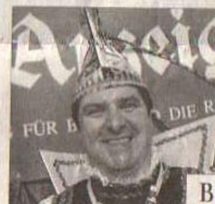
Raimund I.: Graurheindorf